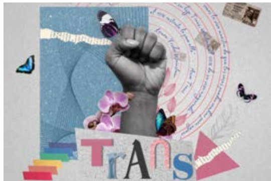
Imagen de la portada